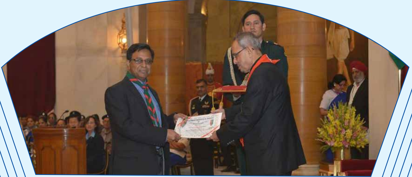
The Chief National Commissioner of Bangladesh Scouts is receiving the highest award of Bharat Scouts and Guides, Silver Elephant from H.E The President of India