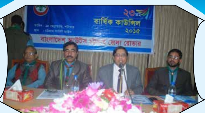
23 rd Annual Council 2015, Chittagong District Rover