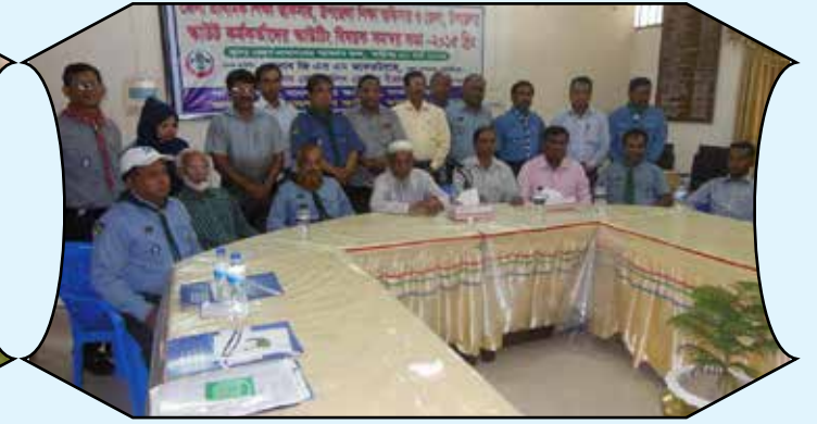
DPEO, UEO with District Upozilla Scouters Meeting, Madaripur