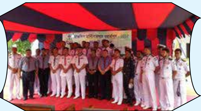
Regional Multipurpose workshop, Sea