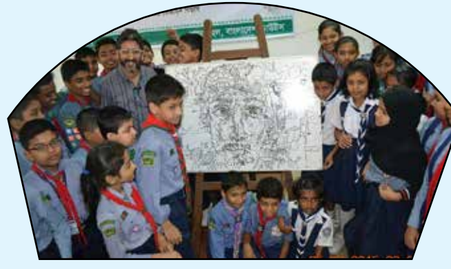
Basic Drawing Course