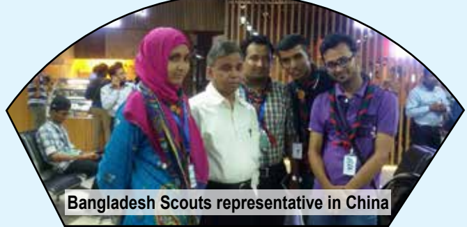
Bangladesh Scouts representative in China