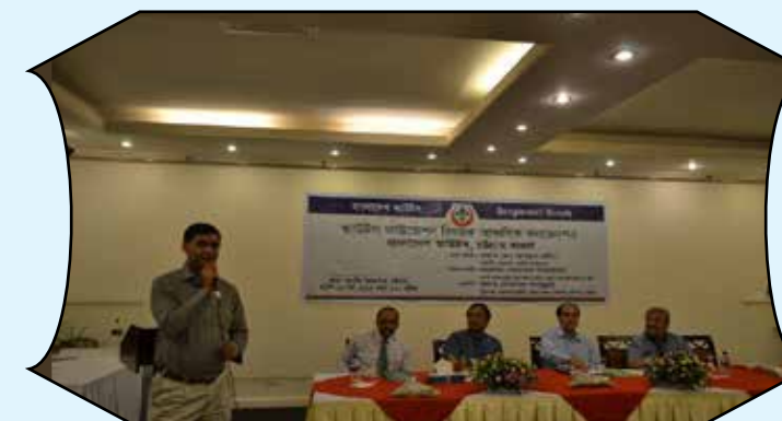
Area Convension of Scout Foundation, Chittagong