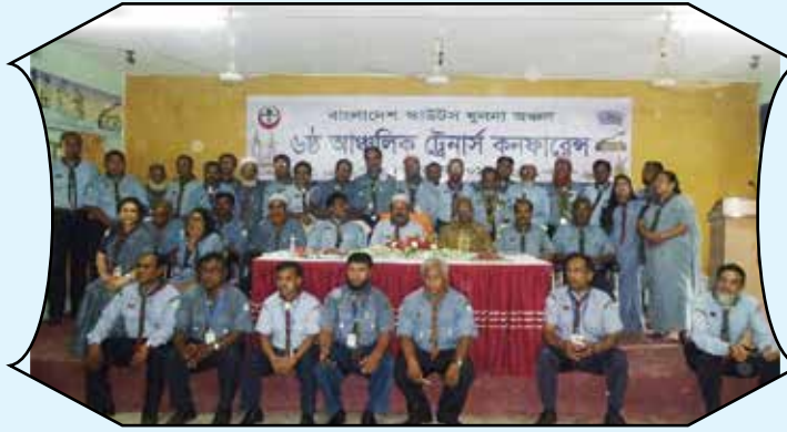
Regional Trainers conference, Khulna