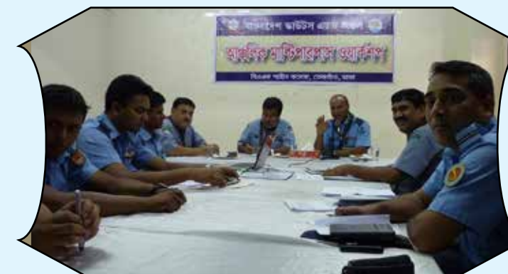
Regional Multipurpose Workshop, Air