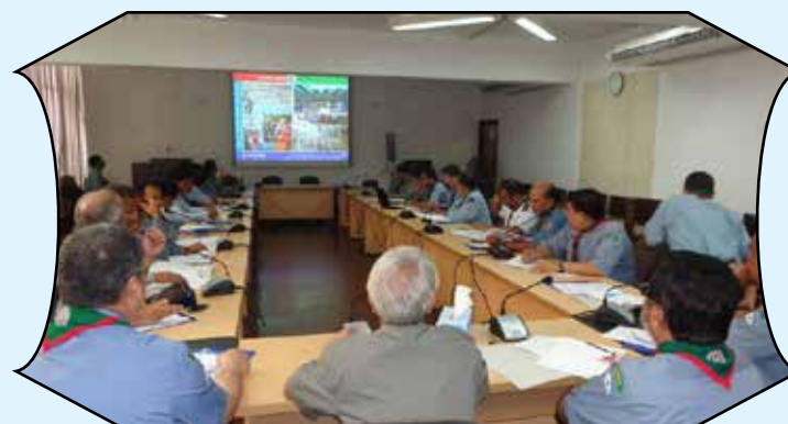
National Program Evaluation Meeting