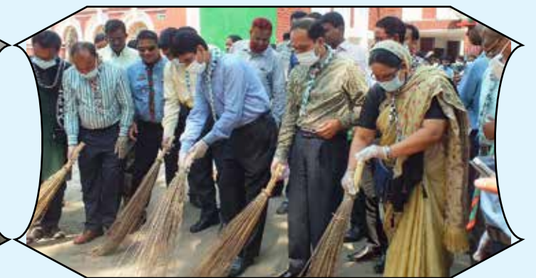
Cleaning Campaign, Rangpur