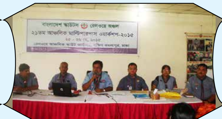
Regional Multipurpose Workshop, Railway