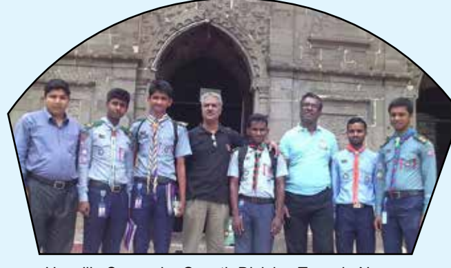
Upozilla Survey by Growth Division Team in Noagoan