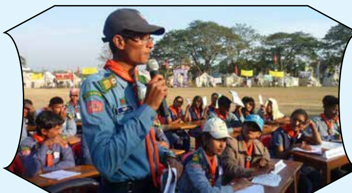
4 th District Rover Moot, Joypurhat