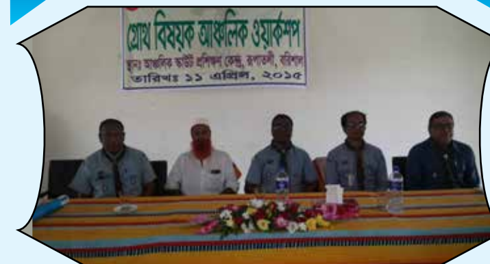
Regional Workshop on Growth