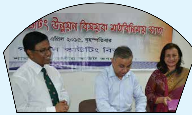
Development meeting of Girl in Scout