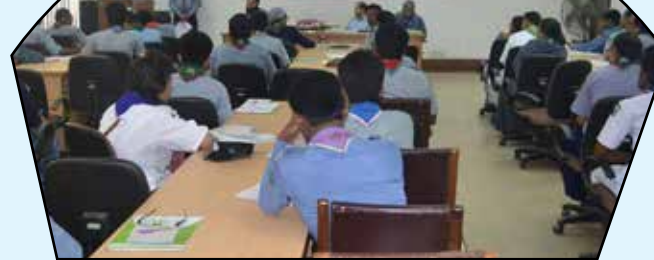
National Review Workshop of Special Event