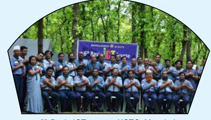
6 th Basic ICT course, NSTC, Mouchak