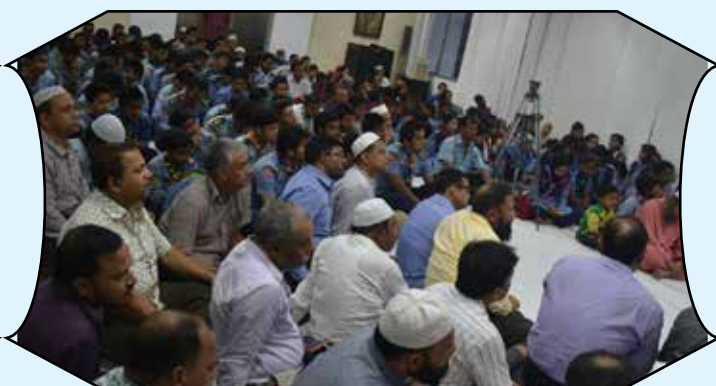
Mourn meeting, NHQ