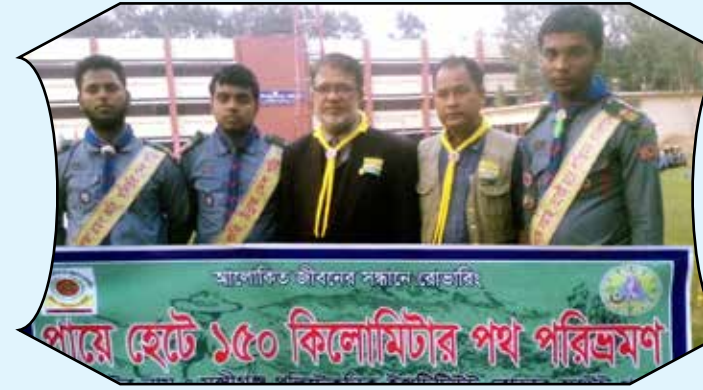
Rambling, Munshiganj District Rover