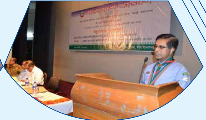
Bangladesh Scouts has Organised a Reception for CNC for Achiving "Silver Elephant" The Highest Award of BSCG