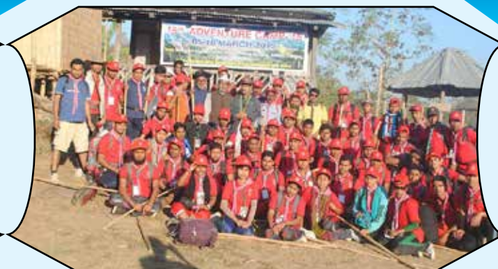
15 th Adventure Camp 2015