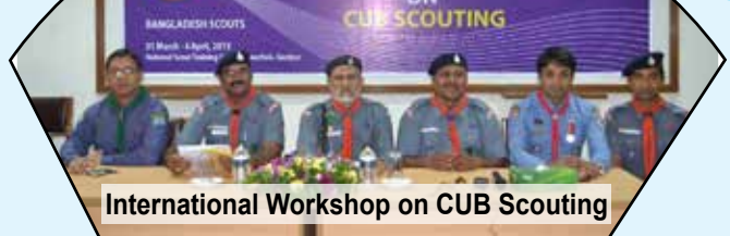
International Workshop on CUB Scouting