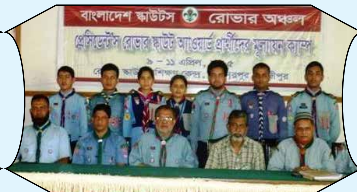
President Rover Scout Evaluation Camp, Bahadurpur, Gazipur