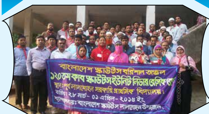
120 th CUB Scout Unit Leader Basic Course