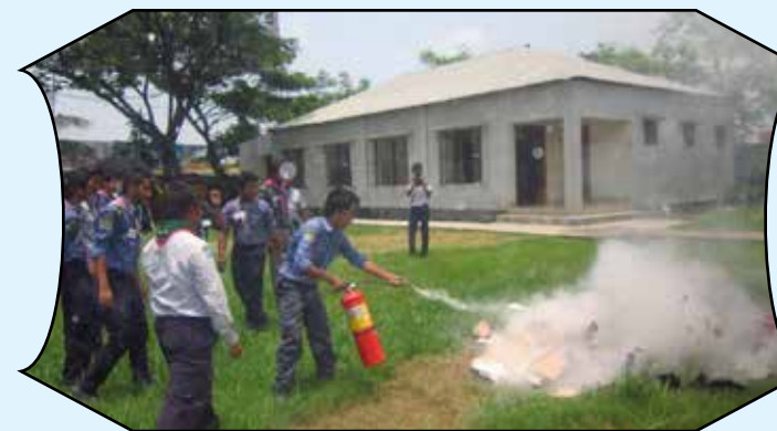
Disaster Management Course, Railway