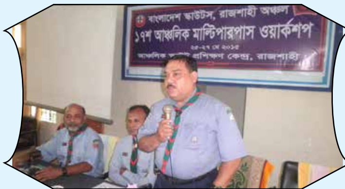
Regional Multipurpose workshop, Rajshahi