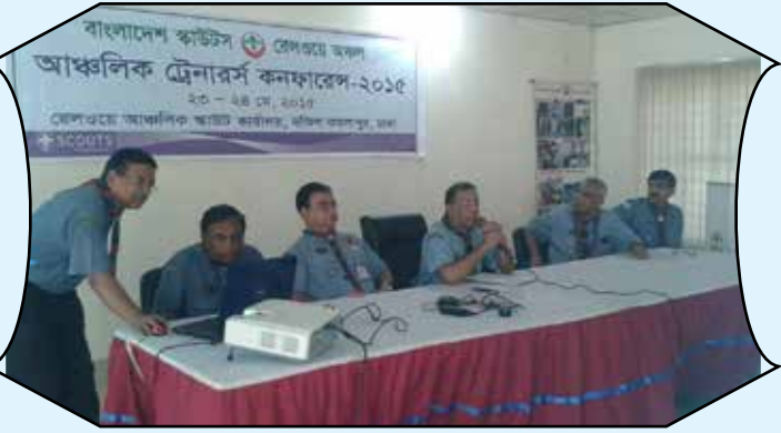
Regional Trainers conference, Railway