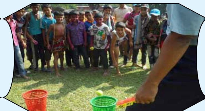
5 th Regional Cub Camporee, Rajshahi