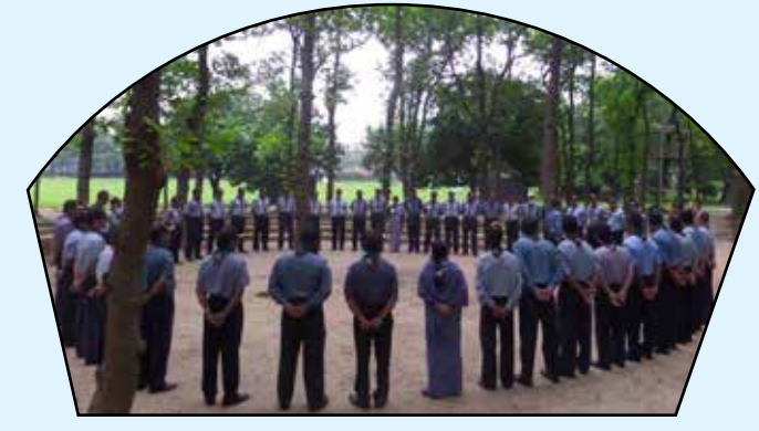
Course for Leader Trainer