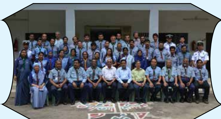
2nd National Membership Growth Evaluation Workshop