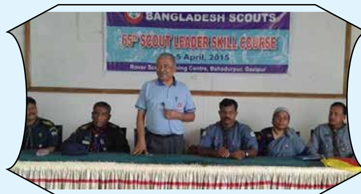
65 th Scout Leader Skill Course