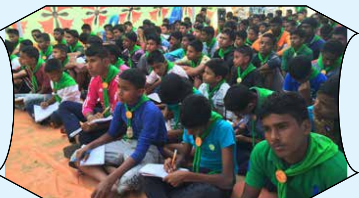
2 nd Upozilla Scout Rally, Sylhet