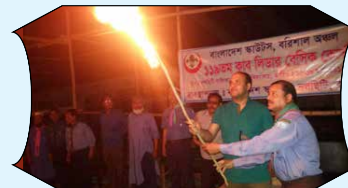
119 th CUB Scout Unit Leader Basic Course