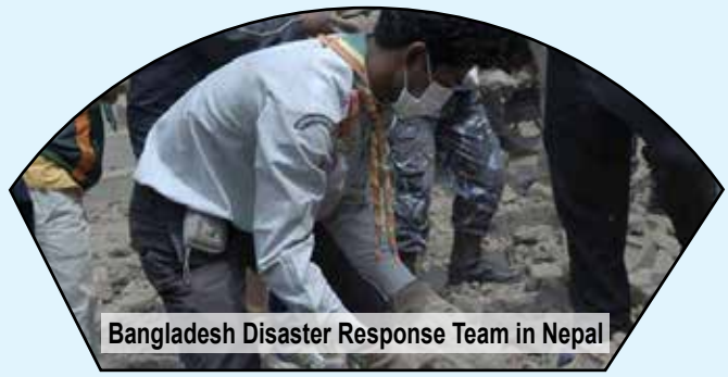
Bangladesh Disaster Response Team in Nepal