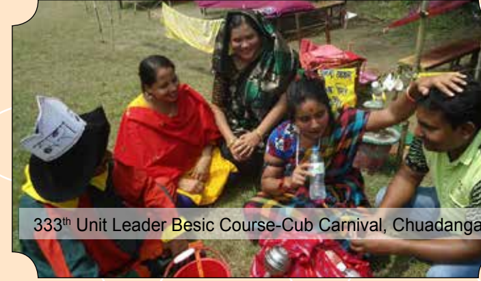
333th Unit Leader Basic Course-Cub Carnival, Chuadanga