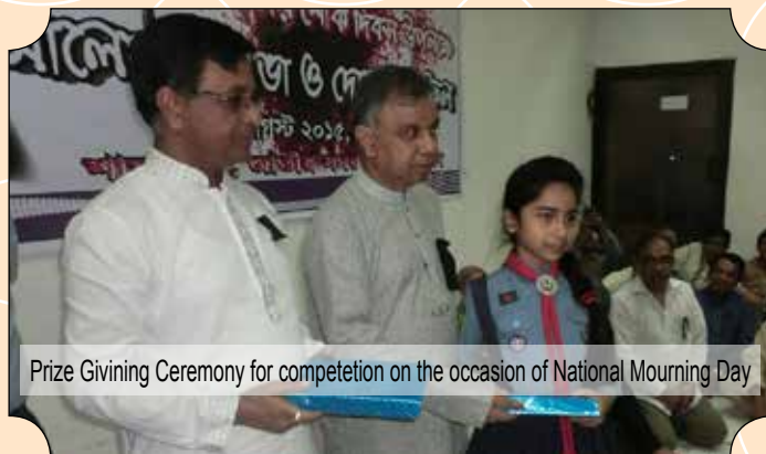
Prize Giving Ceremony for competition on the occasion of National Mourning Day