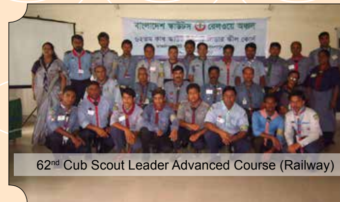
62nd Cub Scout Leader Advanced Course (Railway)