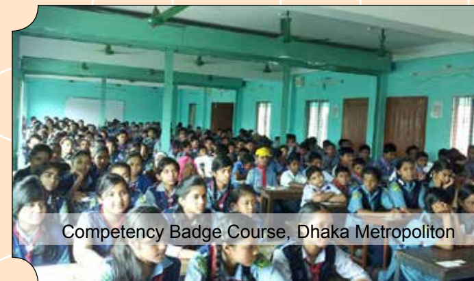
Competency Badge Course, Dhaka Metropolitan