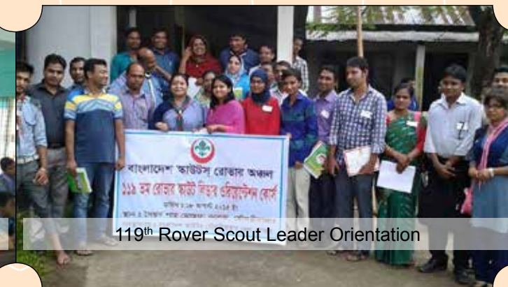
119th Rover Scout Leader Orientation