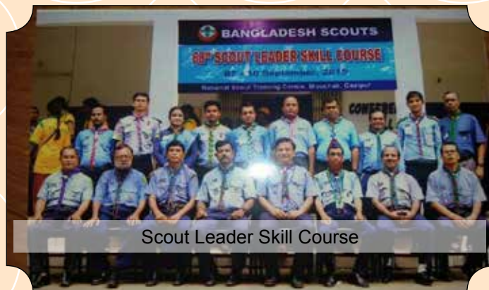
Scout Leader Skill Course