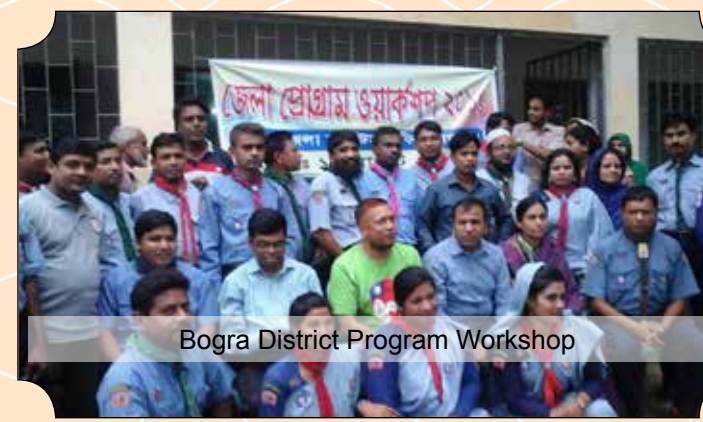
Bogra District Program Workshop