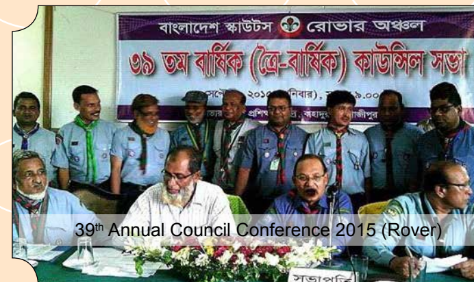
39th Annual Council Conference 2015 (Rover)