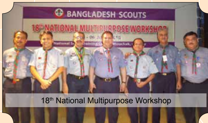
18th National Multipurpose Workshop