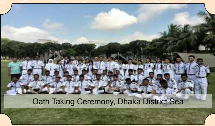
Oath Taking Ceremony, Dhaka District Sea