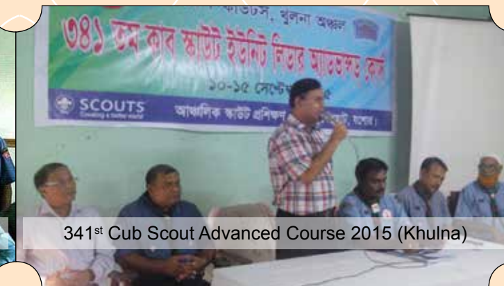
341st Cub Scout Advanced Course 2015 (Khulna)