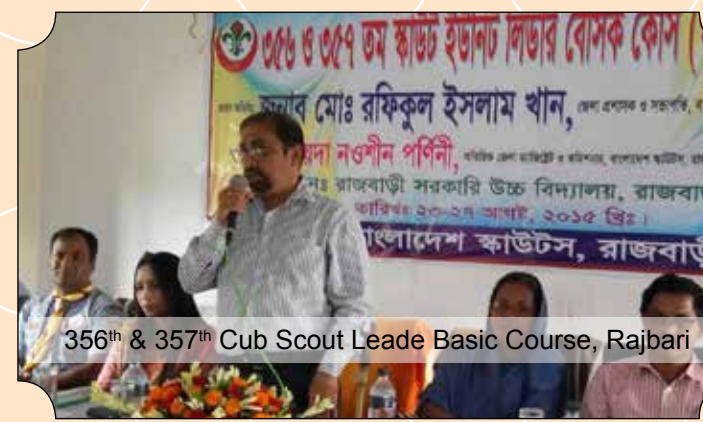
356th & 357th Cub Scout Leader Basic Course, Rajbari