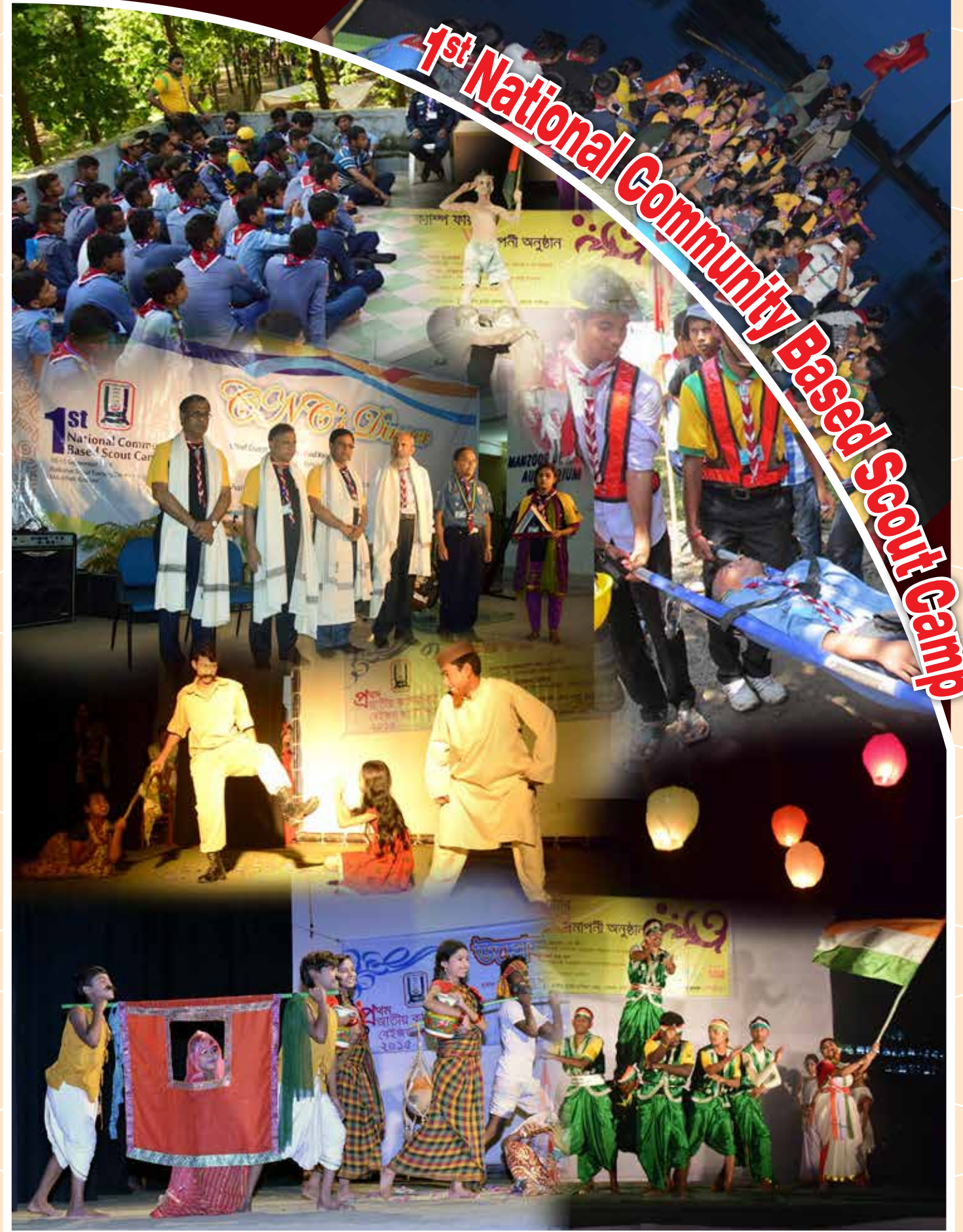
'Teach Scouts not how to get a living, but how to live.' - Robert Baden Powell