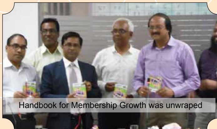
Handbook for Membership Growth was unwrapped