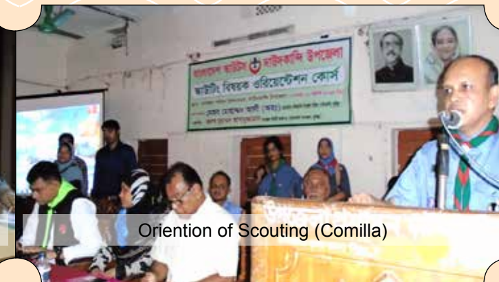
Orientation of Scouting (Comilla)