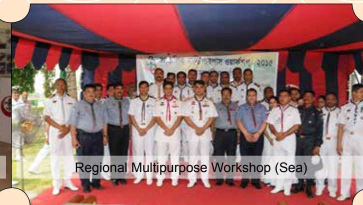
Regional Multipurpose Workshop (Sea)