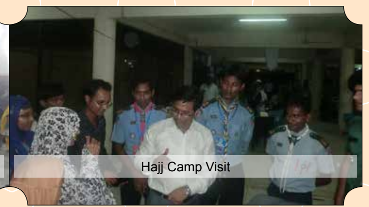
Hajj Camp Visit