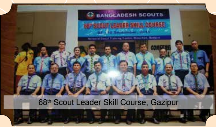
68th Scout Leader Skill Course, Gazipur