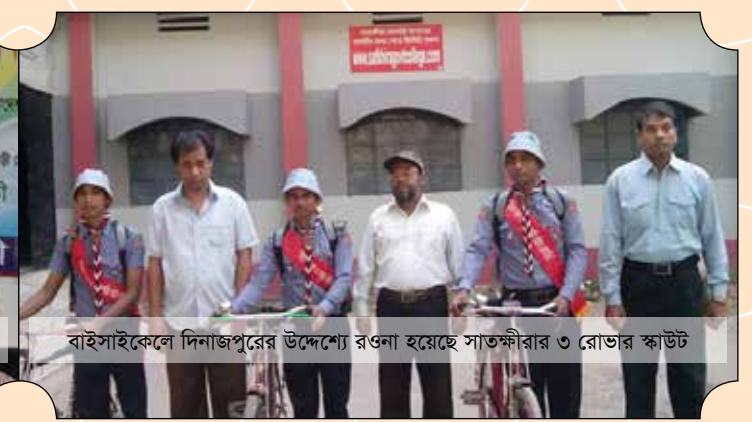
বাইসাইকেলে দিনাজপুরের উদ্দেশ্যে রওনা হয়েছে সাতক্ষীরার ৩ রোডার স্কাউট