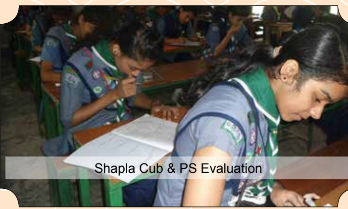
Shapla Cub & PS Evaluation