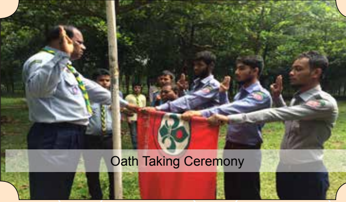
Oath Taking Ceremony