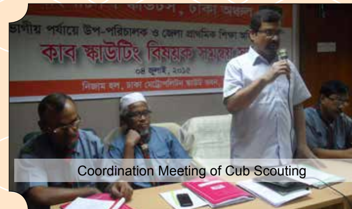
Coordination Meeting of Cub Scouting