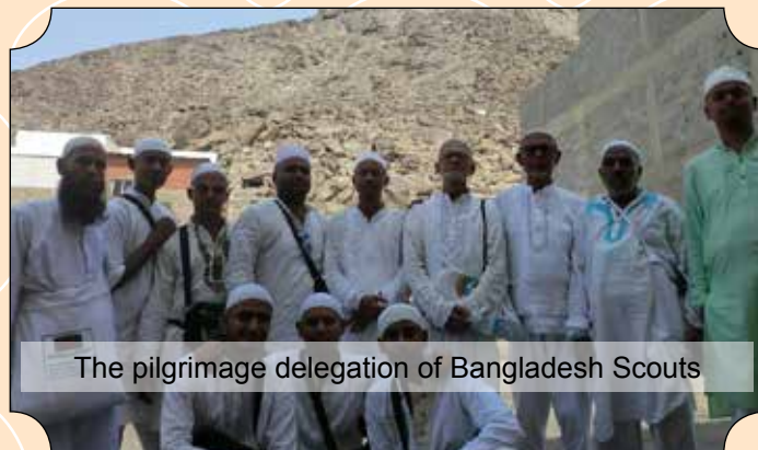
The pilgrimage delegation of Bangladesh Scouts