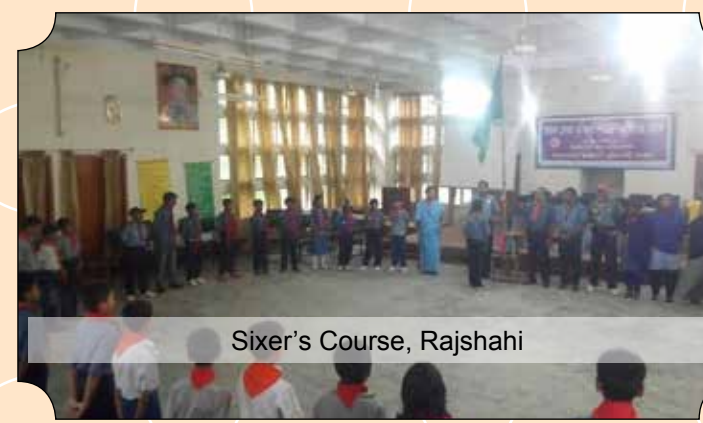
Sixer's Course, Rajshahi