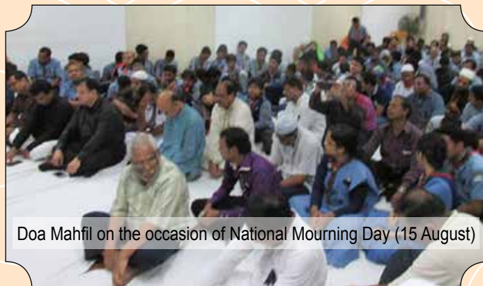
Doa Mahfil on the occasion of National Mourning Day (15 August)