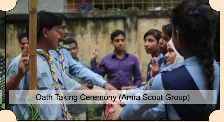
Oath Taking Ceremony (Amra Scout Group)