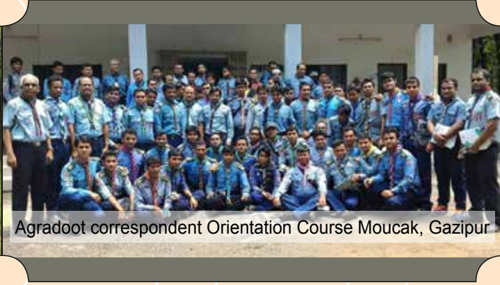
Agradoot correspondent Orientation Course Moucak, Gazipur