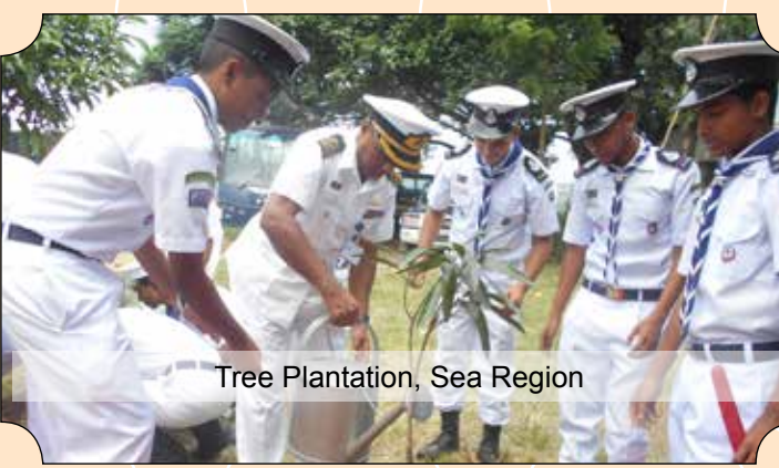
Tree Plantation, Sea Region