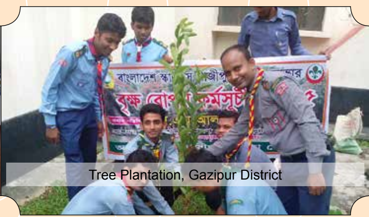
Tree Plantation, Gazipur District