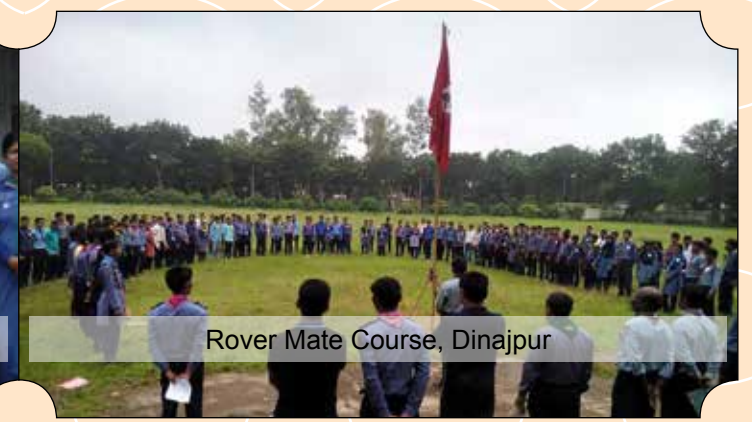
Rover Mate Course, Dinajpur