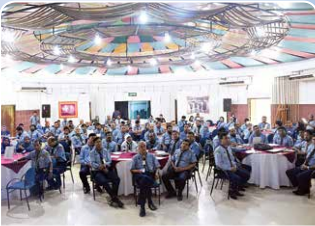
২২তম জাতীয় মাল্টিপারপাস ওয়ার্কশপে অংশগ্রহণকারীদের একাংশ