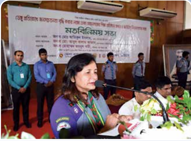
মতবিনিময় সভায় বক্তব্য রাখছেন বাংলাদেশ স্কাউটস এর গার্ল ইন স্কাউটিং বিভাগের জাতীয় কমিশনার