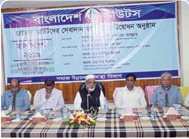
উদ্বোধনী অনুষ্ঠানে মাননীয় ধর্মমন্ত্রীসহ অতিথিবৃন্দ