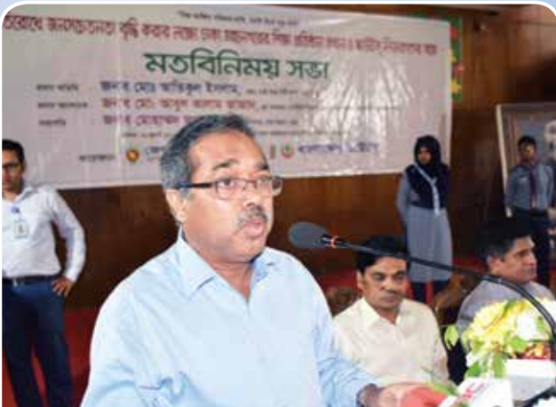
মতবিনিময় সভায় বক্তব্য রাখছেন প্রাথমিক ও গণশিক্ষা মন্ত্রণালয়ের সচিব