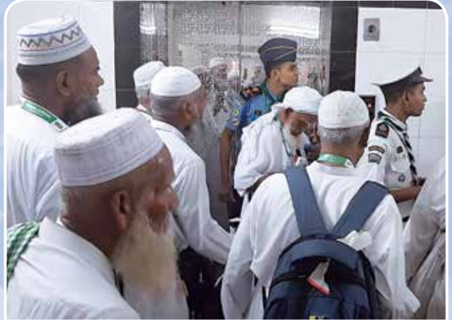
হজ্জ ক্যাম্পে রোভার স্কাউটদের সেবাদান