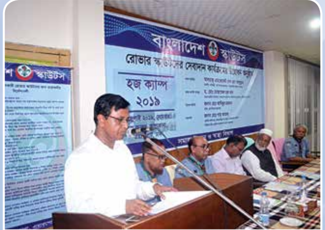
উদ্বোধনী অনুষ্ঠানে বক্তব্য রাখছেন বাংলাদেশ স্কাউটস এর প্রধান জাতীয় কমিশনার