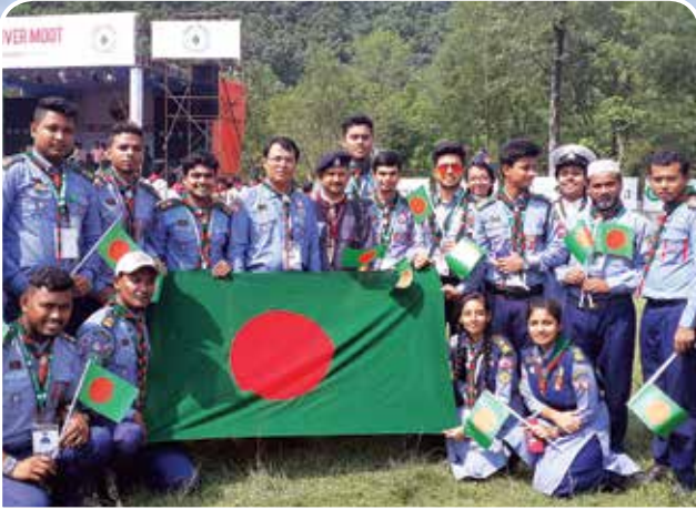
প্রথম জাতীয় রোভার মুট ২০১৯, নেপাল এ বাংলাদেশের রোভারদের অংশগ্রহণ