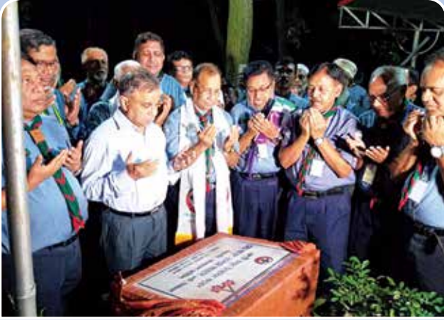
জাতীয় স্কাউট প্রশিক্ষণ কেন্দ্র, মৌচাক, গাজীপুরে লিডার ট্রেনার চক্র উদ্বোধন করছেন বাংলাদেশ স্কাউটস এর সভাপতি