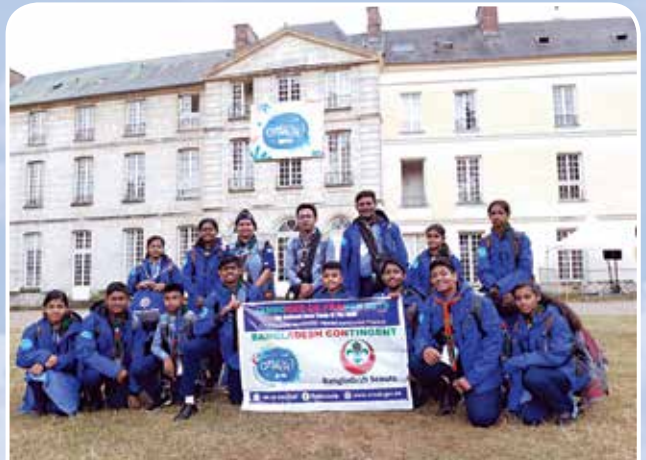
ফ্রান্স ন্যাশনাল জাম্বুরী-২০১৯ এ বাংলাদেশ স্কাউটসের হ্যারিটেজ সাইট ভ্রমণ