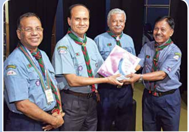
ট্রেনিং টিমের সদস্যদের ২০১৮-২০১৯ সালের পারফরমেন্স এর ভিত্তিতে স্বীকৃতি প্রদান অনুষ্ঠানে উপস্থিত বাংলাদেশ স্কাউটসের উপদেষ্টা