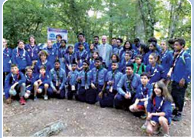
ফ্রান্স ন্যাশনাল জাম্বুরী-২০১৯ এ ফ্রান্সের শিক্ষামন্ত্রীর সাথে বাংলাদেশ স্কাউটসের অংশগ্রহণকারীবৃন্দ