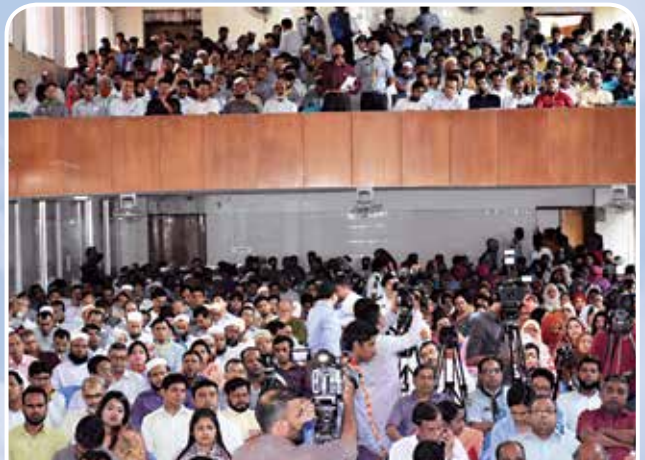
মতবিনিময় সভায় অংশগ্রহণকারীবৃন্দের একাংশ