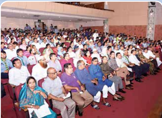
মতবিনিময় সভায় অতিথিবৃন্দের একাংশ