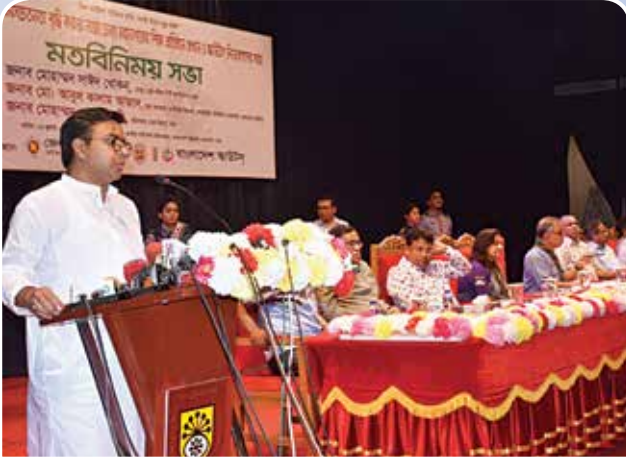
মতবিনিময় সভায় বক্তব্য রাখছেন ঢাকা দক্ষিণ সিটি কর্পোরেশনের মাননীয় মেয়র