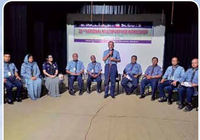
জাতীয় মাল্টিপারপাস ওয়ার্কশপ ২০১৯ এর পরিচালনা পর্ষদ