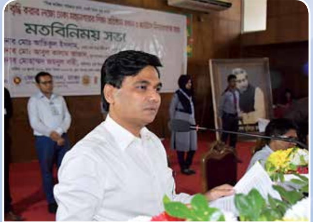
মতবিনিময় সভায় বক্তব্য রাখছেন ঢাকা জেলার জেলা প্রশাসক