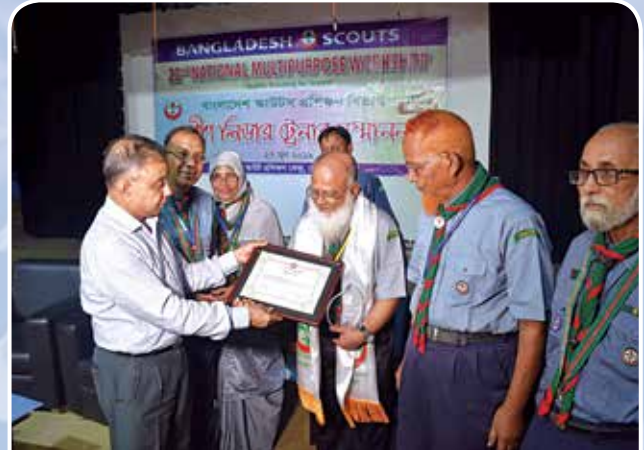
প্রবীণ লিডার ট্রেনারদের সম্মাননা প্রদান করছেন বাংলাদেশ স্কাউটসের সভাপতি