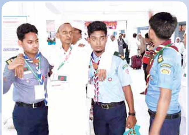
হজ্জ ক্যাম্পে রোভার স্কাউটদের সেবাদান