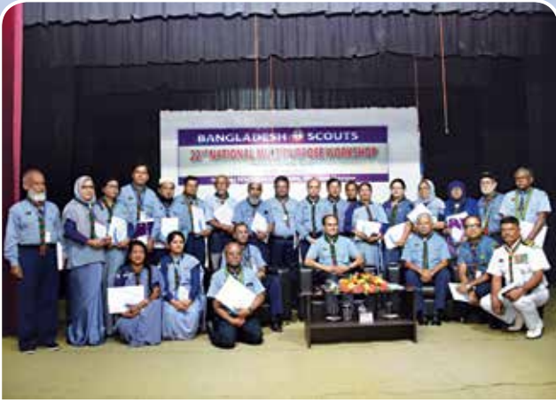
২০১৮-২০১৯ সালে পারফরমেন্স এর ভিত্তিতে স্বীকৃতি গ্রহণকারী ট্রেনিং টিমের সদস্যবৃন্দ