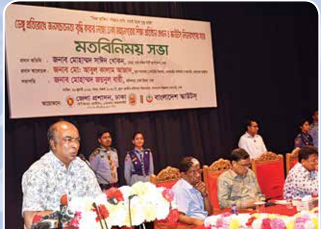
মতবিনিময় সভায় বক্তব্য রাখছেন শিক্ষা মন্ত্রণালয়ের মাধ্যমিক ও উচ্চশিক্ষা বিভাগের সিনিয়র সচিব