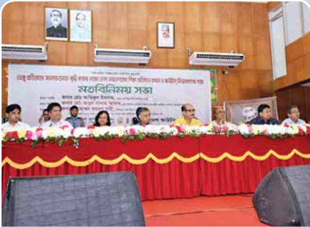
মতবিনিময় সভার অতিথি বৃন্দ