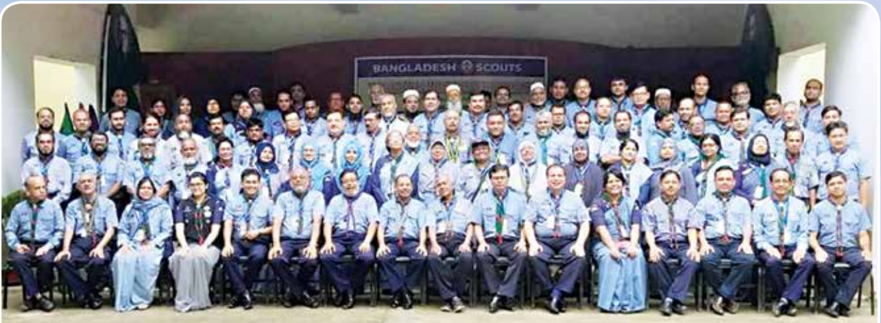
২২তম জাতীয় মাল্টিপারপাস ওয়ার্কশপের অংশগ্রহণকারীবৃন্দ