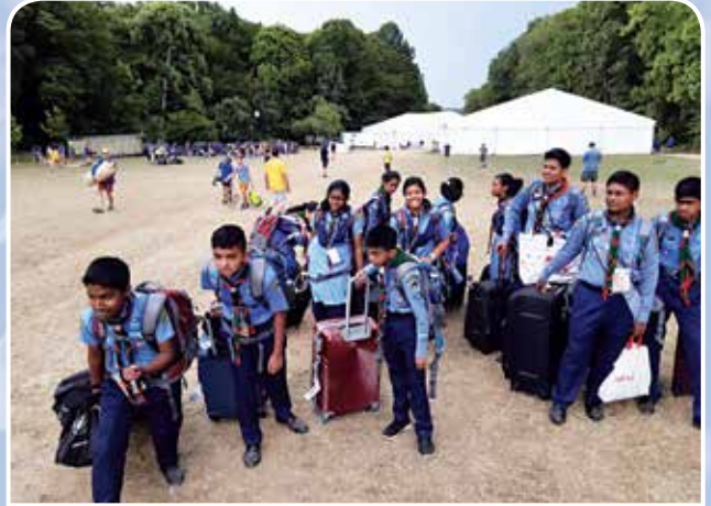
ফ্রান্স ন্যাশনাল জাম্বুরী-২০১৯ এ বাংলাদেশ স্কাউটসের অংশগ্রহণকারীবৃন্দ