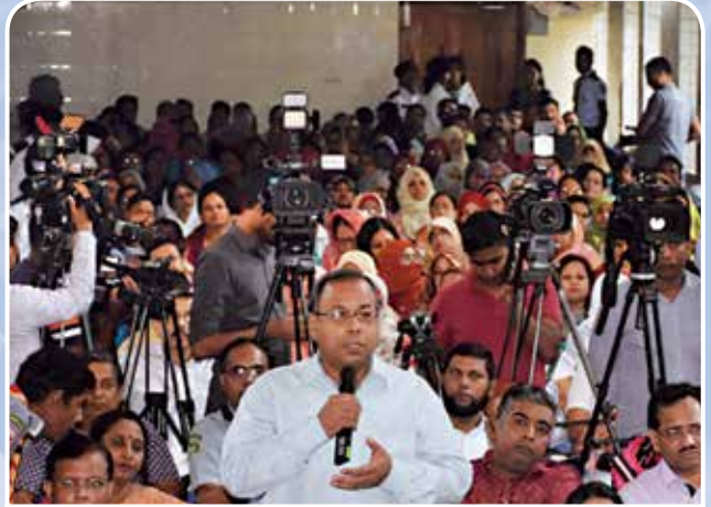
মতবিনিময় সভায় সংবাদকর্মীদের একাংশ