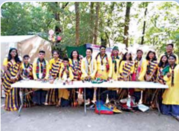
ফ্রান্স ন্যাশনাল জাম্বুরী-২০১৯ এ বাংলাদেশ ডে উদযাপন