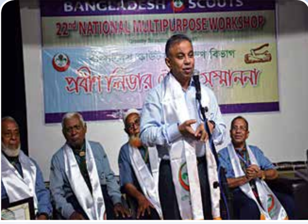
প্রবীণ লিডার ট্রেনারদের সম্মাননা প্রদান অনুষ্ঠানে বক্তব্য রাখছেন বাংলাদেশ স্কাউটসের সভাপতি