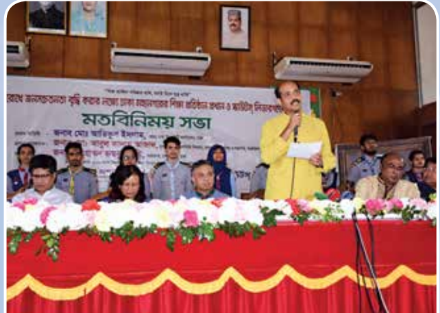
মতবিনিময় সভায় বক্তব্য রাখছেন ঢাকা উত্তর সিটি কর্পোরেশনের মাননীয় মেয়র