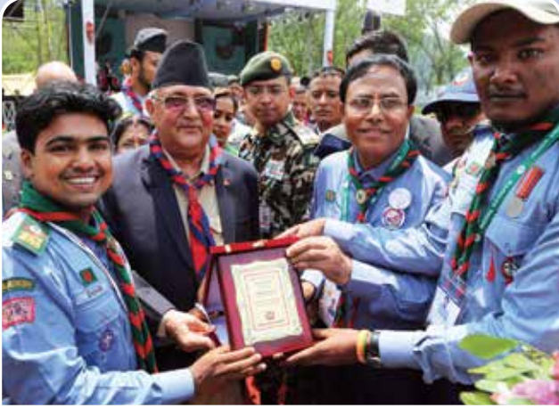
প্রথম জাতীয় রোভার মুট ২০১৯, নেপাল এ বাংলাদেশের স্কাউটসের পক্ষ থেকে নেপালের মাননীয় প্রধানমন্ত্রী খড়্গ প্রসাদ শর্মা আলিকে শুভেচ্ছা স্মারক প্রদান

আন্তর্জাতিক ইভেন্টসমূহে বাংলাদেশ স্কাউটসের অংশগ্রহণ