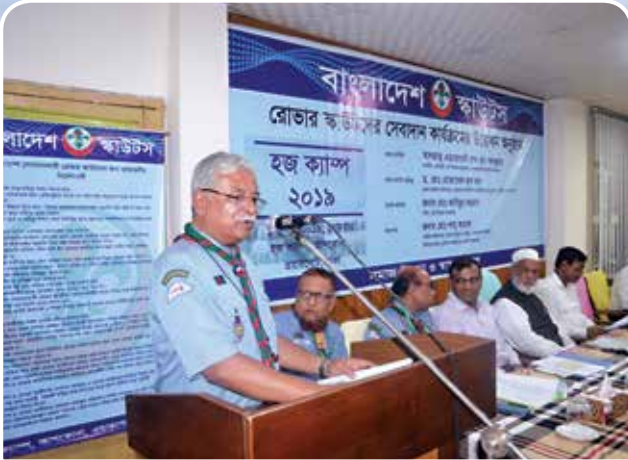
উদ্বোধনী অনুষ্ঠানে বক্তব্য রাখছেন বাংলাদেশ স্কাউটস এর নির্বাহী পরিচালক