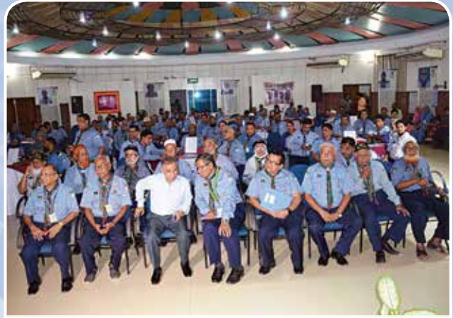
জাতীয় মাল্টিপারপাস ওয়ার্কশপ ২০১৯ এ সোশ্যাল নাইট অনুষ্ঠানের অতিথিবৃন্দ