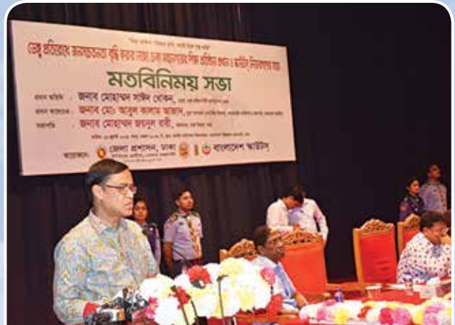
মতবিনিময় সভায় বক্তব্য রাখছেন মাননীয় প্রধানমন্ত্রীর কার্যালয়ের সচিব