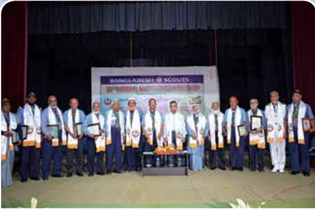
প্রবীণ লিডার ট্রেনারদের সম্মাননা প্রদান অনুষ্ঠান