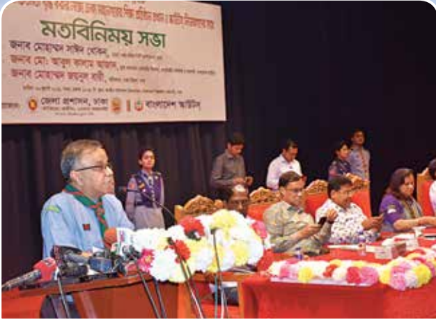
মতবিনিময় সভায় বক্তব্য রাখছেন বাংলাদেশ স্কাউটস এর সভাপতি