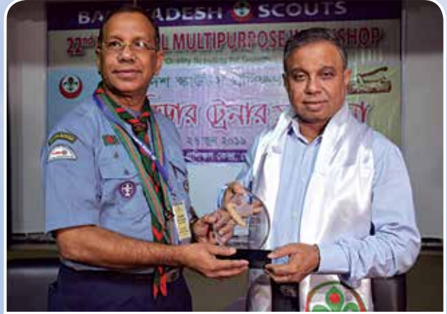
লিডার ট্রেনার সম্মাননা গ্রহণ করছেন বাংলাদেশ স্কাউটস এর সভাপতি