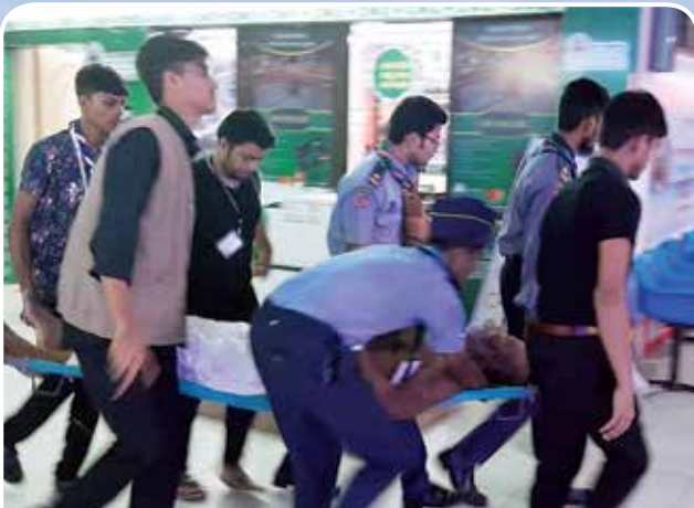
হজ্জ ক্যাম্পে রোভার স্কাউটদের সেবাদান